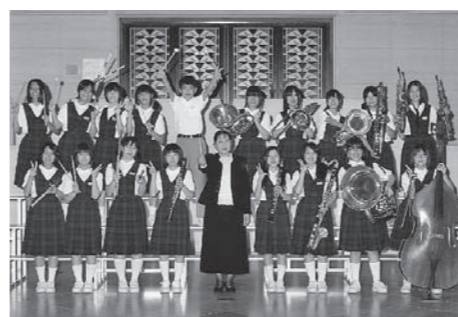
↑吹奏楽部の皆さん