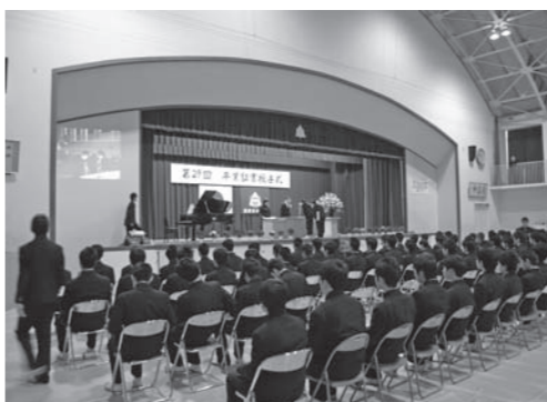
→ 昨年の熊野東中学校の 卒業証書授与式の様子

今年の卒業証書授与式は、熊野中学校、 熊野東中学校ともに、11日(金)に挙行し ます。本年度、熊野中学校では116人、熊 野東中学校では153人が巣立っていきます。 町では、義務教育修了までに「一人前」に なるよう教育活動を進めているところですが、 毎年、そのことが実感できる立派な卒 業証書授与式が行われています。今年も、 卒業生は、歌や別れの言葉に3年間の思い 出を込めながら、堂々とした姿を披露して くれることでしょう。地域の皆さんも、そ れぞれの地域に住んでいる中学校3年生に、 祝福や励ましの言葉を掛けてください。