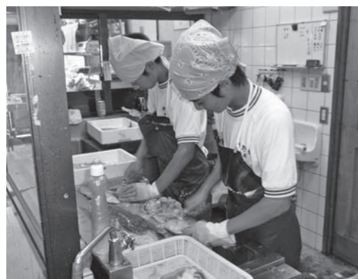
↑昨年の職場体験の様子↓

生徒たちを受け入れてくださる事業所を募 集しています。ご協力いただける場合は、4 月15日(金)までにご連絡をお願いします。 ▽実施期間：7月4日(月)～8日(金)