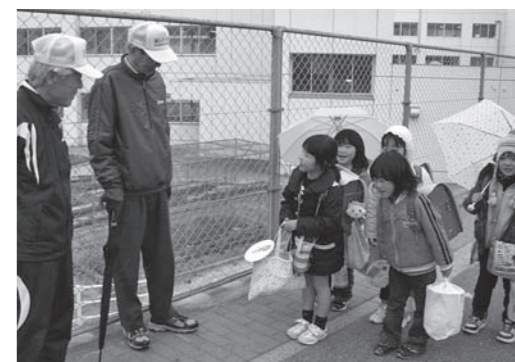
→ 下校ボラン ティアの様子

ボランティアの皆さんから「挨拶の声が良い くなりましたね。」「一生懸命聞いてくれるの で、学校に来るのが楽しみになります。」など の言葉を聞きます。これからも、交流を続け ることで、人に感謝することができる児童を 育てていきたいと思ひます。