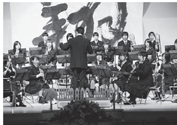
↑定期演奏会の様子

4月10日(土)町民会館講堂において、「第1回熊野高校吹奏楽部定期演奏会」を開催することができました。当日は、町長や県議会議員をはじめ、約500人という大変たくさんの方にご来場いただきました。来場いただきました皆さんならびに、この演奏会にご協力いただきました皆さんに深く感謝とお礼を申し上げます。このたびの演奏会は、本校の柱のひとつである「部活動の活性化」の実践を町民の皆さんに披露するとともに、芸術活動を通して豊かな感性を磨き、人間形成に大きく寄与させていくことを目指し開催しました。今後は、熊野高校生の明るく前向きに努力する姿を定期的に報告できるように、継続した演奏会を開くとともに、地域に愛されるバンドを目指し、努力を積んで参りたいと考えております。今後とも、どうぞよろしくお祈りいたします。