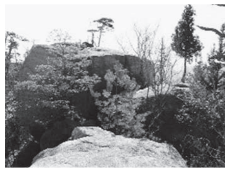
→名前の由来となった3つの大きな岩

協働によるまちづくりを推進するため、昨年度、熊野町まちづくり協働推進事業として、「プロジェクト三石山」の皆さんが、快適に散策や山歩きができるように、くまのファミリー公園を起点・終点とする遊歩道を、三石山(標高449m)に整備しました。これに合わせて、県の「ひろしまの森づくり事業」の里山林整備で、密生した木を一部伐採しました。