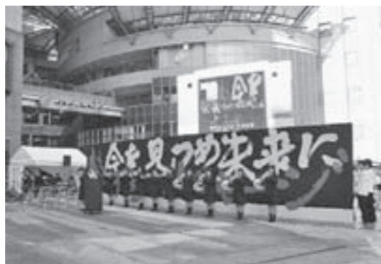
↑ファンファーレ演奏の様子

吹奏楽部は、2月13日（土）には町民会館で卒業演奏会を開催し、地元の皆さんに、この1年間の活動の成果を披露したいと考えています。ぜひ御来聴ください。