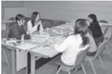
↑実行委員会の様子

熊野町では成人式の式典を、新成人自らが作り上げています。今回も実行委員が集まり、準備を進めています。式典の内容や役割、記念品などを検討しています。