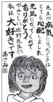
先生が病気に悩んだときはとても心配しました。元気がなくなると、ありがとこの絵てがみを、堀野先生が私に大好きです。あこみ

今年で13回目を迎える「筆の里ありがとこの絵てがみ」の作品募集に伴い、歴代の絵てがみ大賞受賞作品のほか、入賞作品約50点を紹介しています。