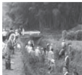
↑町内一斉清掃の様子