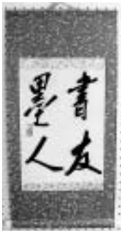
▲このような掛け軸にして、お返しします!

また、全国的に進んでいる毛筆離れを防ぎ、「書」と「筆」の素晴らしさを多くの人に再発見していただくため、ぜひお友達やお知り合いの方にも、この「ふれあい書道展」をご紹介します。