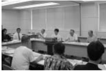
▲平成13年度町政モニターの様子

良い面をさらに伸ばし、悪い面は具体的に一つ一つ片付けていけば、熊野町は日本一の町になるのではないのでしょうか。町側は、住民が何を望んでいるのか、住民は、町側が何をしようとしているのか、お互いによく理解し合い、手を取り合って行政を進めていくことが大切だと思います。本モニター制度もそのためにあるのですから、色々試行しながら立派な制度になることを祈ります。