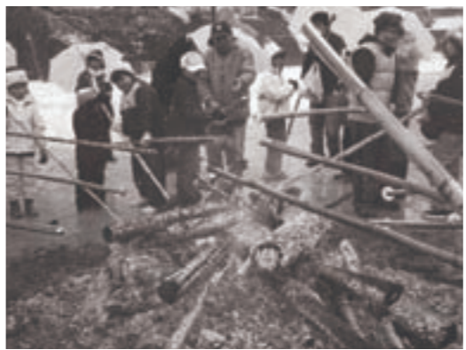
→「とんどまつり」の様子

1月20日(日)「熊二つ子 とんどまつり」を行いました。 前日からおやじの会、PTA役員、地域の名人の方々を中心に子どもたちも手伝って、2基の大きなとんどを造っていただきました。 当日は、雪の降る中、とんどの火は勢いよく、天高く習字を舞い上げ、その荘厳さが強く心に残りました。お餅を焼いたり、ぜんざいを食べたり、地域の人多数参加しての、伝統的なまつり「とんど」で、今年みんなの健康を願いました。