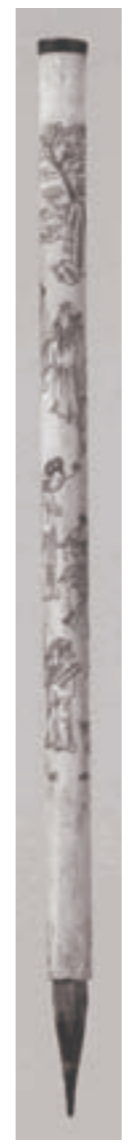
「木村陽山コレクション」13 唐物象牙彫八仙文筆

道教で尊ばれる「八仙」つまり八人の仙人が細い象牙の筆管に彫られています。仙人一人一人には逸話があり、神通力を発する固有の持ち物を携えています。例えば、武人の呂洞賓は剣、女性の何仙姑は蓮華など。これらの仙人は不老長寿の象徴として敬われ、日本の「七福神」のように親しまれています。