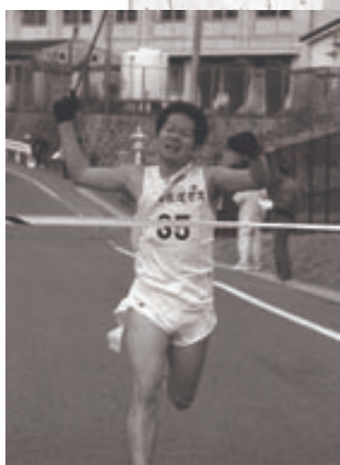
昨年の優勝チーム