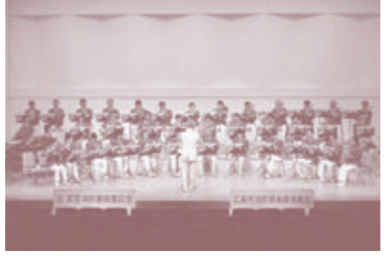
→安芸市消防音楽隊による開署記念コンサートの様子