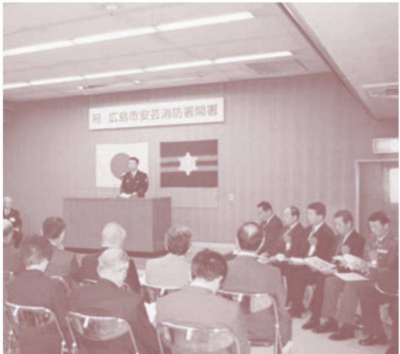
盛大に開催された開署式の様子

これまでの海田地区消防本部が、4月1日から、安芸消防署として新たなスタートを切りました。 これを記念して5月10日(木)、安芸消防署において平本町長をはじめ、約100名の来賓が出席し開署式が催されました。