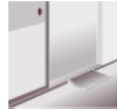
↑5mmの段差でもつまづきの原因になります

動きやすく環境を整えるとは具体的にどんなことでしょうか。例えば、家の中でいつも通る場所には、つまづきやすいものを置かないようにしましょう。段差な