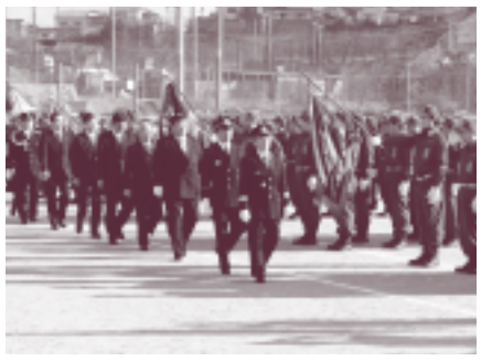
↑ 昨年の出初式の様子