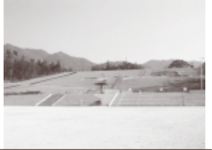
(仮称)深原地区公園整備事業