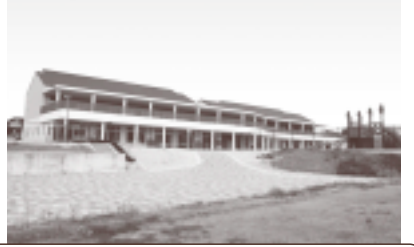
子育て支援拠点施設整備事業 (町立保育所の整備)