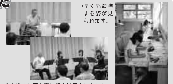
↑心地よい音と声に館内は包まれました

7月20日(水)、待望の図書館がオープンいたしました。開館日当日は、開館式典、朗読会などの催しがあり、多くの人で賑わいました。新しい図書館に、ぜひお越しください。