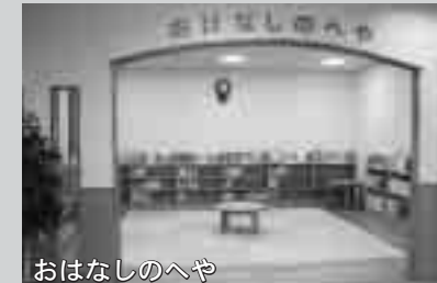
おはなしのへや おはなし会や紙芝居ができる畳の部屋です。