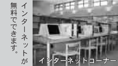
インターネットが無料で使えます。