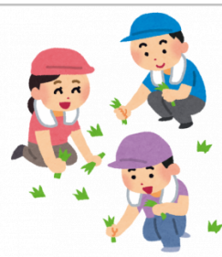
【熊野町親孝行便】草抜き(手作業)6時間相当(2人×3時間)

肉の中でも人気の、「ロース」と「もも」を贅沢にかたまりで約1kgずつご用意しました。ミンチもおいしい部位を使用して作りました。 【提供元】広熊ジビエ専門 (TEL082-854-0333)