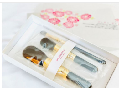
熊野化粧筆宙高級リス毛3本セット

【熊野市・熊野町友好都市協定締結記念コラボ返礼品】【洗顔ブラシ】軸に熊野市の伝統工芸品である那智黒石を使用し、きめ細かくみずみずしい泡がつけれます。【チークブラシ】軸に熊野市の伝統工芸品である那智黒石を使用しました。