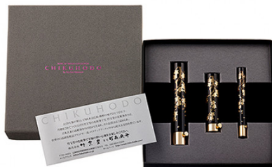
熊野化粧筆携帯蒔絵3本セット(BR-8)