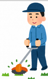
【熊野町親孝行便】草刈り(機械使用)6時間相当(2人×3時間)

熊野筆伝統工芸士が製作した扱いやすい羊毛筆1本と、なめらかな書き味のイタチ毛小筆2本の3本セットです。 【提供元】熊野筆事業協同組合 (082-854-0074)