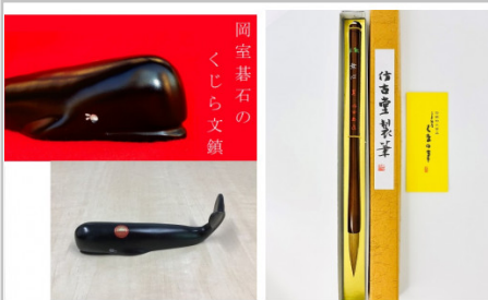
【熊野市・熊野町コラボ返礼品】那智黒石くじら文鎮&熊野筆書筆(羊蹄筆)

4時間相当(2人×2時間)のできる範囲で、木の剪定をいたします。親族などお世話になった方や、土地などを所有している方など、熊野町にゆかりのある方を対象とした返礼品です。熊野町内限定となります。 【提供元】一般社団法人熊野町シルバー人材センター (TEL082-855-0881)