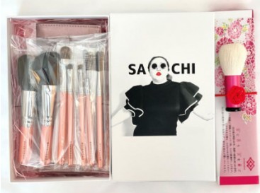
熊野化粧筆萌人氣ブラシ7本&洗顔ブラシ&ケースwithSACHI-BOX