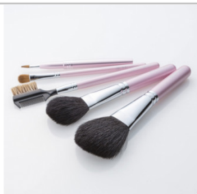
熊野化粧筆【日本ギフト大賞2015広島賞】ピンクパール5本セットPK-47

パウダーブラシ、チークブラシ、アイシャドウブラシ、アイブロウブラシの4本セット 【提供元】株式会社NUMBEHEIGHT(082-554-8883)