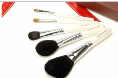
熊野化粧筆【クールジャパンフェスティバル受賞】ホワイトパール5本セット

【日本ギフト大賞2015広島賞受賞！】 2015年県内で“唯一” 弊社の商品が受賞した名誉ある日本ギフト大賞の都道府県賞（広島県賞）です。弊社の商品がはじめて受賞しました！ 【提供元】宮尾産業（TEL082-854-0337）