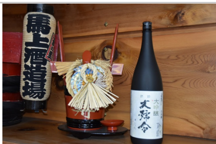
清酒大号令大吟醸1.8L