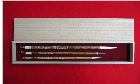
熊野筆書筆伝統工芸土作3本セット

【熊野市・熊野町コラボ返礼品】 熊野市：那智黒石くじら文鎮【提供元】熊野市駅前特産品館(Tel0597-89-6018) 熊野町：熊野筆書筆(羊蹄筆)【提供元】仿古堂 (TEL082-854-0003)