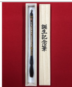
赤ちゃんの誕生記念筆引換券熊野町