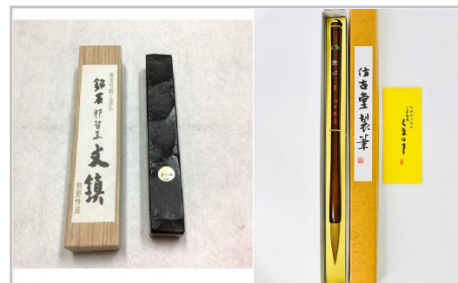
【熊野市・熊野町コラボ返礼品】那智黒石仮谷梅管堂の高級文鎮&熊野筆書筆（羊蹄筆）

手作業にて、8時間相当（2人×4時間）のできる範囲での草抜きをいたします。熊野町在住の親族がいらっしゃる方や、町内に土地を所有している方など、熊野町にゆかりのある方を対象とした返礼品です。熊野町内限定の作業となります。 【提供元】一般社団法人熊野町シルバー人材センター(TEL082-855-0881)