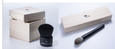
【熊野市・熊野町友好都市協定締結記念コラボ】洗顔ブラシ＆チークブラシ