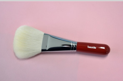
熊野化粧筆フェイスブラシ(粗光峰)軸色：赤

草刈り機を使用し、6時間相当(2人×3時間)のできる範囲での草刈りをいたします。熊野町在住の親族がいらっしゃる方や、町内に土地を所有している方など、熊野町にゆかりのある方を対象とした返礼品です。熊野町内域限定の作業となります。 【提供元】一般社団法人熊野町シルバー人材センター (TEL082-855-0881)