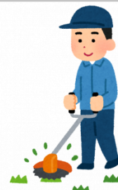
【熊野町親孝行便】草刈り(機械使用)8時間相当(2人×4時間)