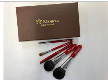
熊野化粧筆メイクブラシ5本セット