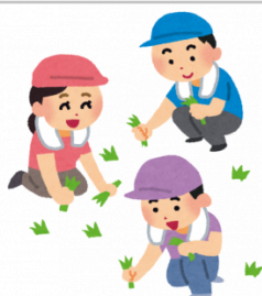
【熊野町親孝行便】草抜き（手作業）8時間相当（2人×4時間）

フェイスブラシ・チークブラシ・アイシャドウブラシ×2・アイブロウブラシ・ブラシ&コム・スクリュブラシの7本セットです。YouTube「SACHI沙智ちゃんねる」さんとのコラボ商品「SACHI-BOX」でお届けします。 【提供元】仿古堂(TEL082-854-0003)