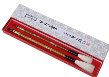
熊野筆書筆羊毛筆2本セット

【提供元】一般社団法人熊野町シルバー人材センター(TEL082-855-0881)