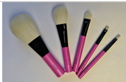
熊野化粧筆vivid（ヴィヴィッド）