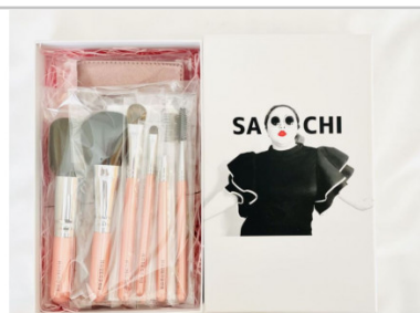
熊野化粧筆萌人気ブラシ7本&ケースwith SACHI-BOX

フェイスブラシ・チークブラシ・アイシャドウブラシ×2・アイブロウブラシ・ブラシ&コム・スクリュブラシの7本セットです。ギフト箱にてお届けいたします。 【提供元】仿古堂(TEL082-854-0003)