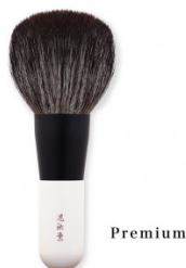
熊野化粧筆【P-1】premiumシリーズパウダーブラシ