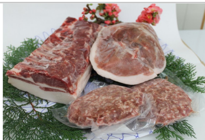
広熊ジビエのかたまり肉セット(イノシシ)約2.4kg熊野町産

日本酒度は+4 とやや辛口のお酒です。(アルコール度数16度以上17度未満) ※未成年者の飲酒は法律で禁止されています。未成年者のお申込みはご遠慮ください。 【送付元】馬上市酒造場(082-854-0104)