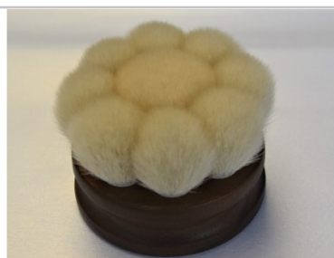
ボディブラシ花型熊野筆