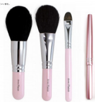
熊野化粧筆パールピンクセット