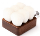
熊野化粧筆SHAQUDAスーヴェボディブラシシショート