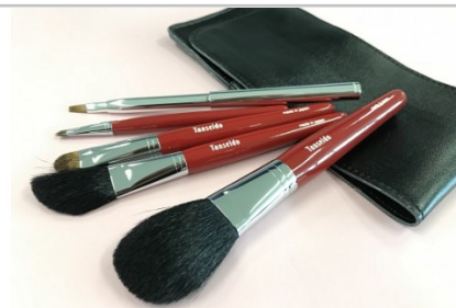
熊野化粧筆グレイスセット軸色：赤