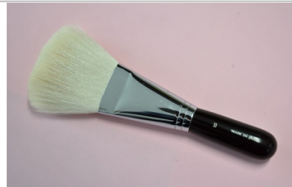
熊野化粧筆フェイスブラシ(粗光峰)軸色：黒

粗光峰(山羊)の毛を使った、フェイスブラシです。扇形で毛量も多く、コシがあります。仕上げに粉を払ったり、フェイスパウダーをのせるメイクをされる方に人気です。 【軸色】赤 【提供元】株式会社丹精堂 (082-854-0215)