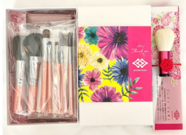
熊野化粧筆萌人氣ブラシ7本&洗顔ブラシ&ケース（ギフト箱）