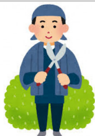
【熊野町親孝行便】木剪定6時間相当(2人×3時間)

【提供元】一般社団法人熊野町シルバー人材センター(TEL082-855-0881)