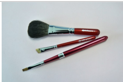
熊野化粧筆レッドパール3本セットBR-S-1

赤ちゃんの生まれて初めて生えた頭髮で、誕生記念の筆を熊野筆伝統工芸士が制作します。筆の軸へ、赤ちゃんのお名前とお誕生日を彫刻します。（発行日から3年間有効）