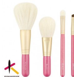
熊野化粧筆4本セット

！！ヘアメイクアーティスト推奨メイクブラシ！！ 熊野化粧筆3本セットは早くきれいに楽しくメイクできます。 【提供元】宮尾産業（TEL082-854-0337）