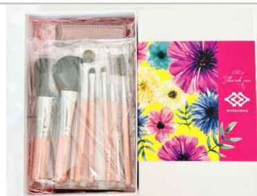
熊野化粧筆萌人気ブラシ7本&ケース（ギフト箱）

【クール・ジャパンフェスティバル受賞！】 2012年4月30日、日印国交樹立60周年にインドにて「クール・ジャパン」として、日本の代表的な伝統品として紹介されました。 【提供元】宮尾産業（TEL082-854-0337）