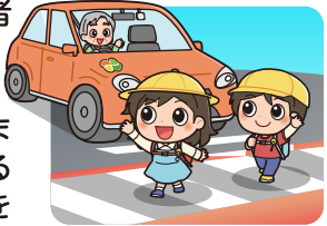
横断歩道は歩行者優先

横断歩道は歩行者優先です。運転者には横断歩道手前での減速義務や停止義務があります。歩行者の横断を妨げないようにしましょう。歩行者や他の車両に対する「思いやり・ゆずり合い」の気持ちを持って運転しましょう。