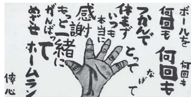
ありがとう大賞 古武家倅心 (熊野中2年)

※1月19日(金)は、作品入替のため、見学できません。 ※広島県の奨励賞の展示は、1月4日(木)～18日(木)です。