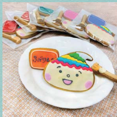
@kumano_town_official アイデアコンテストでのアイデアが早速カタチに。熊野町民会館で「ふでりんクッキー」が実現しました。 #くまぐら #ふでりん #アイデア #筆

みんなの投稿が広報くまので紹介されるかもしれないリン♪ 「#くまぐら」をつけて投稿するリン♪