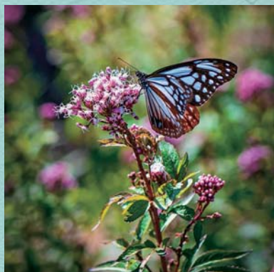
@8370ryuhiro 深原地区公園のアサギマダラ #くまぐら #アサギマダラ #深原地区公園 #熊野町を盛り上げ隊