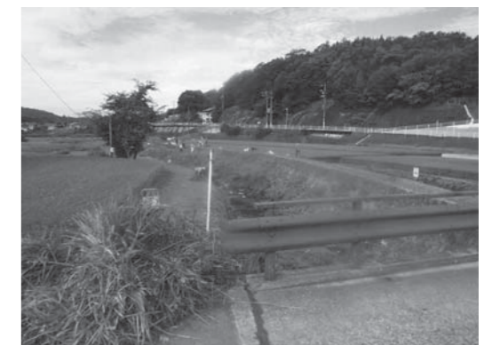
熊野町公衆衛生推進協議会（生活環境課）