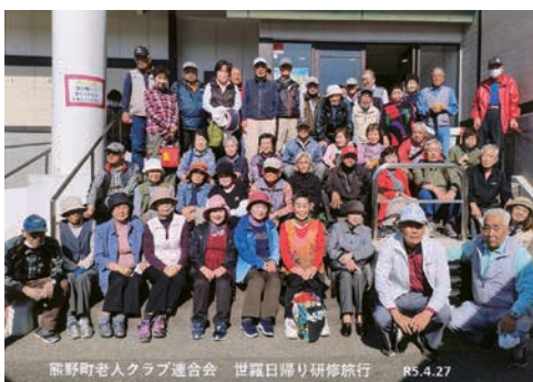
◀大勢が参加した日帰り研修旅行

A 健康づくり活動として、グランドゴルフ大会を春と秋の年2回行っています。毎回、150人が参加し、団体戦の優勝チームは県大会に出場しています。ゴルフ大会も年2回実施しています。健康寿命を延ばして介護のいらぬ体づくりに励んでいます。