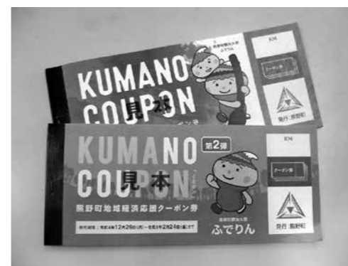
※写真は過去のクーポン券