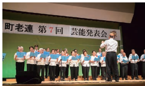
◀楽しい芸能発表会

生きがいづくり活動では、町民会館ホールで芸能発表会を行っています。毎回200人の参加者がカラオケ、民謡、踊りなどを披露されています。三村町長も歌で参加いただいています。