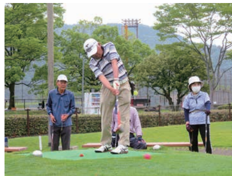
◀パークゴルフ大会の様子

A 今年からパークゴルフ大会を始めました。近隣に専用のパークゴルフ場もあり、新しい会員の開拓につなげたいと思います。