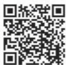
▲町ホームページはこちら