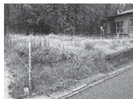
◀中溝一丁目町有地

申込要領を財務課で配布します（町ホームページにも掲載）。なお、申し込みおよび入札は郵送（簡易書留）または直接持参の方法により受付します。