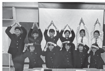
▲熊高アートディレクションコースの皆さん

アートの力で町を盛り上げるため、熊高アートディレクションコースの皆さんが「ふでりん」のプロジェクトに就任しました。熊高では「ふでりん」をプロジェクトするにあたり全校生徒からプロジェクト名を募集しており、プロジェクトは着々と進行しています。