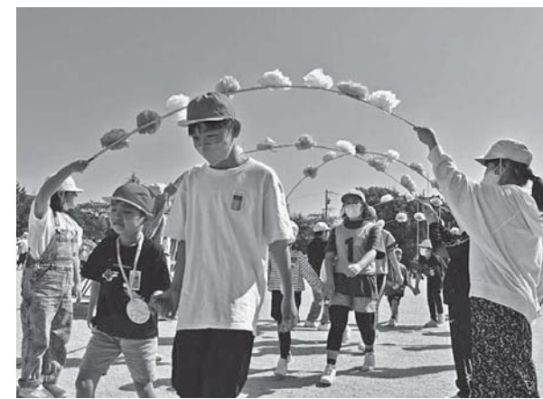
▲上級生に手をひかれて入場する1年生

5月2日(火)には、運動場で1年生を迎える会を行いました。1年生は、5年生が作ってくれた花のアーチをくぐって入場し、6年生から手作りのペンダントをもらい、縦割り班で自己紹介をしたりゲームをしたりしました。頼りになるお兄さんやお姉さんと活動するうちに、緊張していた1年生も笑顔になっていきました。1年生が笑顔になり、2～6年生もとてもうれしそうでした。その後、ペア学年で一緒に遠足に出かけ、楽しい1日を過ごすことができました。