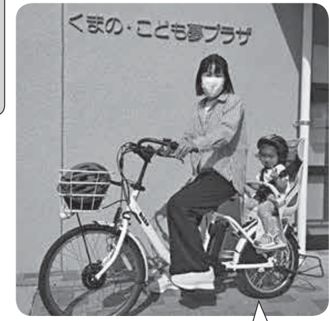
子どもも自転車でのお出かけが大好きになりました

①申込書をくまの・こども夢プラザに提出してください。電話での予約もできます。 【注意事項】 予約は1か月前から可能です。 数に限りがあるため、自転車などが全て貸し出されている場合は待ついただくこととなります。 自転車貸出の場合、利用決定者には子育て支援センターで安全講習DVD(10分程度)を観ていただきます。