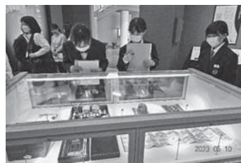
▲貴重な香道の道具を鑑賞する生徒たち

生徒は、「普段見ることができない貴重な作品を鑑賞できてよかった」、「香道って面白い」、「香を全部当てることができ楽しかった」などの感想をもちました。今回の本物の作品に触れる機会を通して、日本独自の歴史や文化、美意識について理解を深めることができ、充実した時間を過ごすことができました。