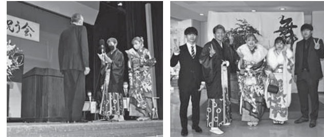
▲昨年度の二十歳を祝う会の様子