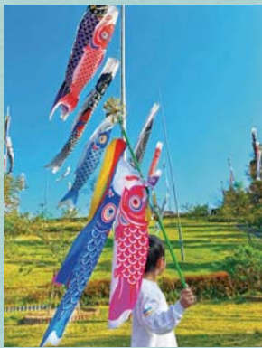
@kumano_town_official 深原地区公園の100匹の大きな鯉のぼり。その下で、小さな鯉のぼりも元気にはらっぱを走り回っています。 #くまぐら #こどもの日 #日本の風景