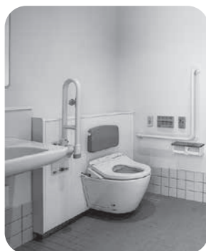
▲屋外多目的トイレ

令和4年4月1日に開所した熊野西防災交流センター新館を視察し、シャワー室、備蓄倉庫、ペット避難スペースなどの施設を確認した。