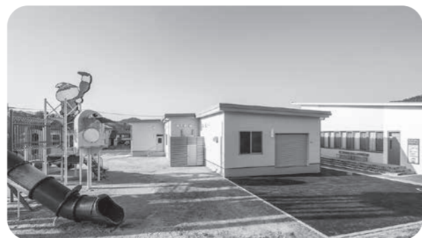
▲旧くまの・みらい交流館横に隣接する施設で、住民からの要望が多かった屋外トイレも設置されています。