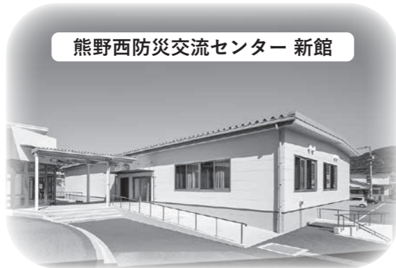
熊野西防災交流センター 新館