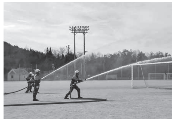
▲消防団放水訓練の様子