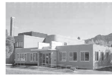
▲熊野町中央地域健康センター

デイルーム 1時間900円 町外の者 1時間1,800円 時間外の使用それぞれ 1時間1,500円加算する