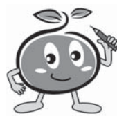
農林業センサスマスコットキャラクター「つっちー」

▼調査期日：2月1日現在1月中旬から調査員が農林業を営んでいる皆さまのところに訪問して、調査票に農林業の経営状況などの記入をお願いします。 調査票に記入された事項については、統計以外の目的には使用されませんので、ご協力をお願いします。