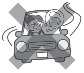
令和元年広島県交通安全年間スローガン