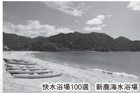
快水浴場100選 新鹿海水浴場