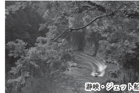
瀨峡・ジェット船

熊野市の山間部には、良好な泉質の湯ノ口温泉や日本の棚田百選の丸山千枚田、北山川からなる紀伊半島随一の溪谷美を誇る瀨峡や大又川をはじめとする清流があって、南端の三重県と和歌山県との県境には一級河川の熊野川が流れているの。この流域や七里御浜、奈良県吉野郡、和歌山県の一部にかけて「吉野熊野国立公園」の区域になっているんだよ！