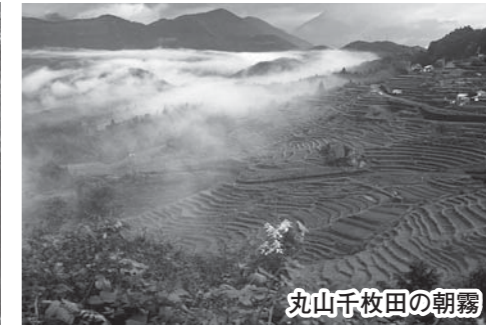
丸山千枚田の朝霧