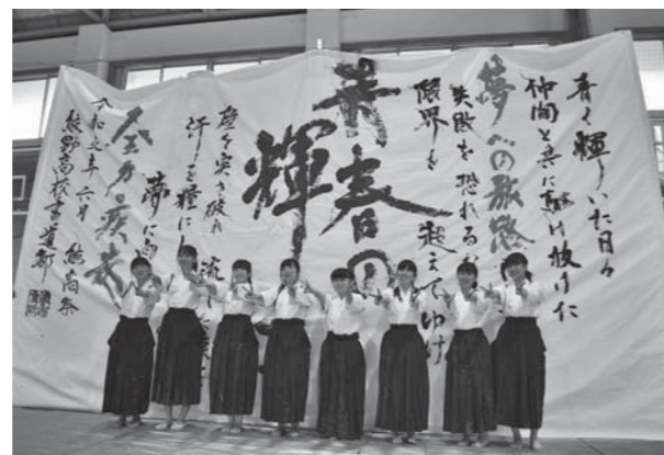
「熊高祭書道パフォーマンス」

御来場の皆さまには、坂町のサンスターホールで開催した合唱コンクールを含め様々な場面で明るく主体的に活躍する熊高生の姿を御覧いただけたいと思います。全ての生徒が輝くことのできる学校として様々な取り組みに果敢に挑戦致しますので、今後とも応援よろしくお願い致します。