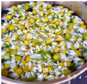
#摘みたく #カモミールティ