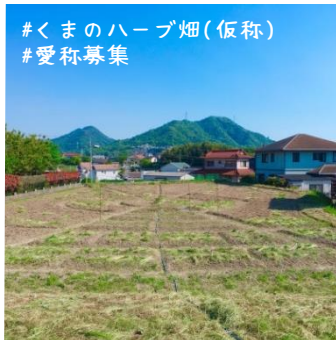
#くまのハーブ畑(仮称) #愛称募集