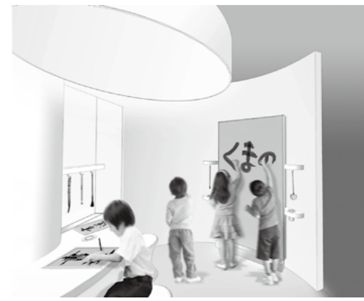
体験ゾーン「水書き」

筆に水をつけて書くと、筆跡が見える「水書き書道」ができる小さな部屋です。書筆のほか、白鳥の羽、植物の枝で作った特殊筆、画筆など、さまざまな筆を、自由に手に取って、書いてみる事ができます。 書家や画家のパフォーマンスのように、立ったまま壁にも書くことができます。水が乾くと消えるので、作品を残したい人は撮影もできます。