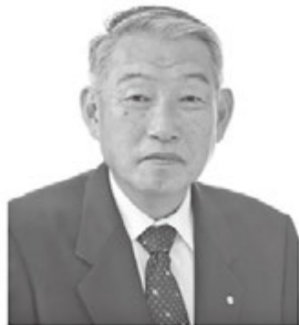
熊野町長 三村 裕史

大正7年に誕生した熊野町は、平成30年10月1日で町制施行100周年を迎えました。本町は、江戸時代から伝わる筆の製造を産業の中心として「筆の都」として栄えてきました。これまで、町の発展を支えてくださいました多くの方々に深く感謝を申し上げます。