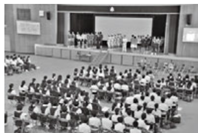
「運動部紹介の様子」

豪雨災害の影響で、普段の生活を取り戻すには、まだまだ時間がかかるものと思われます。本校では、様々な相談に応じながら、新年度生徒受け入れに向け、力を尽くしてまいります。