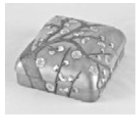
尾形光琳「梅時絵箱」個人蔵

10月16日(火)からは後期展が始まり、一部作品が入れ替わります。トラりんモチーフとなった「竹虎図」、金屏風に四季の花や鳥が見事に描かれた「四季花鳥図屏風」などの名品が登場します。わかりやすい鑑賞ガイドも配布しています。どうぞお楽しみください。