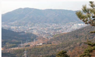
▲山頂付近より(出来庭地区方面)

間で山頂に到達した。山頂付近では、熊野町・呉市苗代町と郷原町の3方面を見渡すことができ、素晴らしい眺めが眼下に広がる。