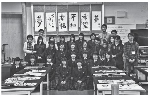
「書道体験後の写真撮影」

このような国際交流を体験することで、コミュニケーション能力を鍛え、熊野筆の良さや書道の素晴らしさを伝えると共に、自らの特技を披露できる人材に成長してほしいと願っています。