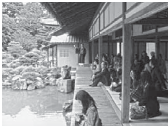
京都ツアーの様子

「筆の里PAL会員」という賛助会員には、筆の里工房からさまざまな催事や展覧会の案内を送付するほか、教室や催事の優先受付や参加費割引、ショップ商品の割引(オリジナル商品のみ)、提携美術館の入館や飲食店での割引、筆の里工房の入館料免除などの特典があります。PAL会員200円(年会費)ほかファミリー、ジュニア会員などもあります。