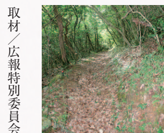
取材／広報特別委員会

い道程であるが、数カ所ある小川が、疲れた心をホッとさせてくれる。まず、前藤ノ木山に着くと、少し迂回し、尾根沿いに南峰まで歩く。南峰から山頂を抜け、北峰から登山道入口付近へ繋がる出口を目指し下山した。前藤ノ木山・南峰では、苗代市街を一望でき、北峰では正面に熊野市街、右に「呉地ダム」、左に