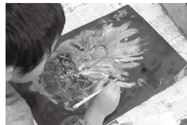
アートパラダイス