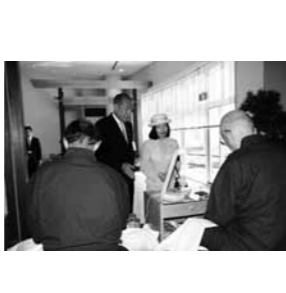
三笠宮彬子女王殿下