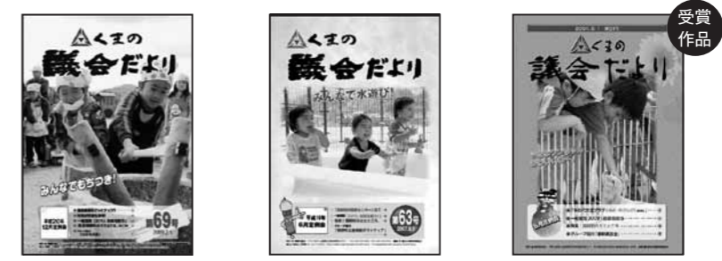
第70号（平成21年5月発行） 第69号（平成21年2月発行） 第63号（平成19年8月発行） 第51号（平成16年8月発行）