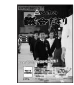
第70号（平成21年5月発行）