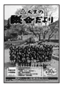
第90号（平成26年5月発行）