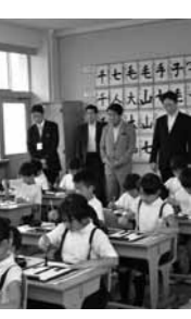
下村文部科学大臣