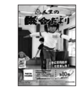
第80号（平成23年11月発行）