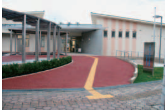
▲「くまの・みらい交流館」正面

町民の多世代交流、生涯学習活動の拠点として「くまの・みらい交流館」が5月9日にオープンしました。この施設は、自治会や子ども会活動のほか、各種サークル活動やイベントなどにご利用いただけるよう、会議室を5部屋、ステージと音響機器を備えた集会室、その他調理室や美工室などが整備されています。