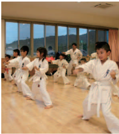
▲集会室 子ども達の稽古風景 (新極真会 大演道場)

まず、玄関を入るとそこは、中庭を囲み、自然光の入るロビーが広がります。とても開放的なロビーで、ゆつくりとくつろぐことができそうです。