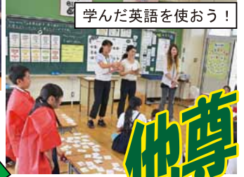
学んだ英語を使おう！