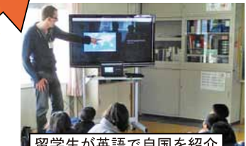
留学生が英語で自国を紹介