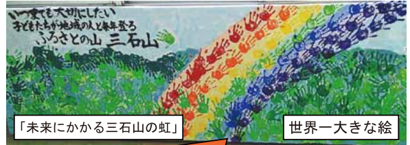
「未来にかかる三石山の虹」