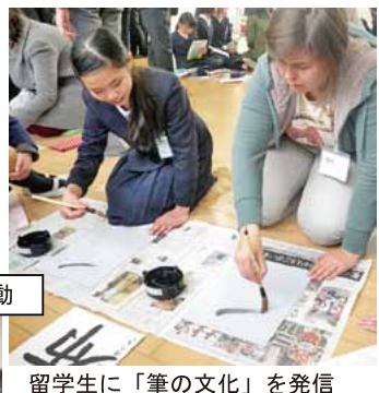
留学生に「筆の文化」を発信