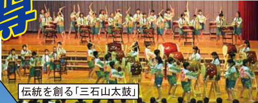
伝統を創る「三石山太鼓」