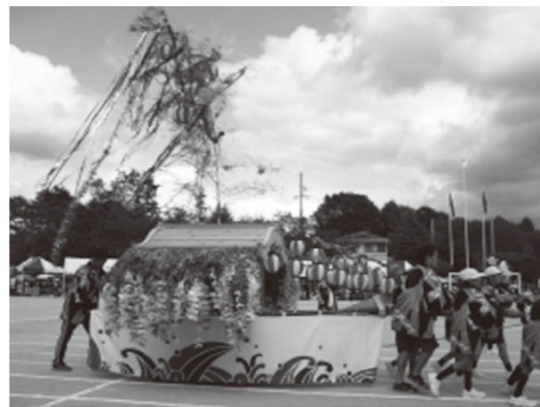
はっぴを着て、彼岸船をひいて入場

熊野第三小学校では、毎年の運動会で「筆おどり」を行っています。運動会前に、女性会の方々に指導をしていただきました。ありがとうございます。 また本年度は、地域テーマ募金で購入した立派な「彼岸船」、3・4年生全員そろいの新調した「はっぴ」を着て、筆おどりをお見せすることができました。 地域の皆様、保護者の皆様、ご協力ありがとうございました。