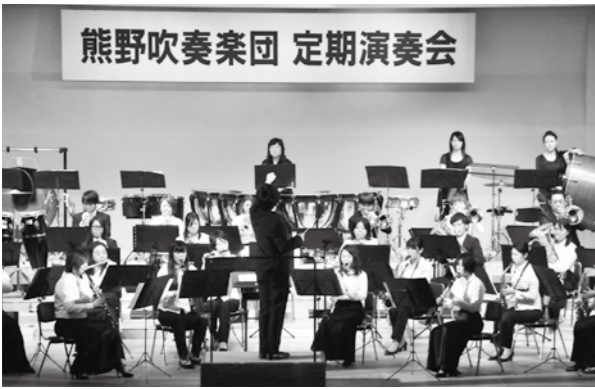
熊野吹奏楽団 定期演奏会

※駐車場が大変混み合いますので、公共交通機関のご利用や、お乗り合わせをお願いいたします。