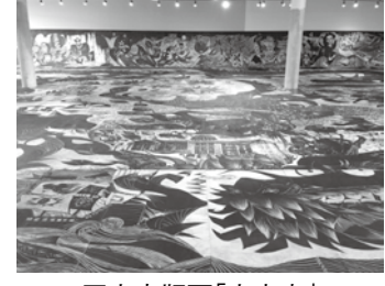
巨大木版画「大宇宙」

熊野町観光案内所「筆の駅」 熊野町出来庭10・6・24 ☎855・1123 開館時間 10時～16時 入場 無料