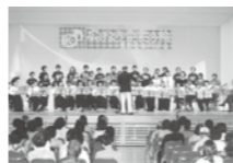
コンサートの様子