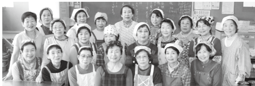
緑綬褒状 社会奉仕活動功績 アイリス食事会

地域の高齢者の交流の場として月に1度「食事会」の場を提供してきたボランティアグループ「アイリス食事会」が受章されました。