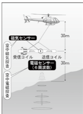
空中物理探査の測定概要図

広島県広島水道事務所では、水道用トンネルの設計に役立てるため熊野町西部の山地において地質構造を把握する目的で、ヘリコプターに各種観測機器をつり下げ調査する予定です。この調査のため、ヘリコプターが熊野町西部周辺を低空で飛行します。