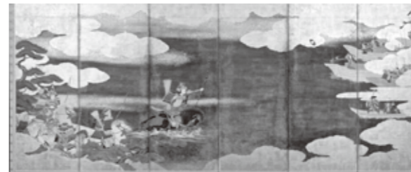
源平合戦屋島図屏風 (明王院蔵)

NHK大河ドラマで使用した衣装などとともに、広島と平氏政権の関わりや『平家物語』世界の拡がり、熊野とのつながりも紹介されます。