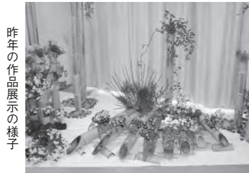
昨年の作品展示の様子

このたびの文化祭では、平成13年6月のオープンから10周年を記念して、生きがい文化講座、自主グループの書道、絵手紙、折り紙、生け花、小物作りなどの作品展示のほか、太極拳の実演(午前9時半~10時半)、健康体操の実演(午前10時40分~11時40分)、フラダ