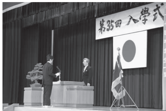
新入生あいさつの様子

義務教育を終え、これから始まる新たな高校生活が、希望あふれるものとなるよう、一人ひとりがしっかりとした目標を持ち、強くたくましく成長してくれることを願っています。