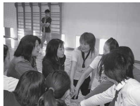
昨年のP T A球技大会の様子

毎年恒例のP T A球技大会(ソフトバレーボール)を今年も実施します。本校では、世帯数が少ないにも関わらず保護者の集まりが良く、継続して実施しています。チームも各学年に加えて、年によっては「教職員チーム」や「おやじチーム」が参加しています。2週間前から休日を利用して練習するなど、意気込みも相当なものです。保護者同士、保護者と教職員との関わりがより密接になり、円滑な連携で物事がうまく進んだということもあります。大切にしたい行事の1つです。これからも継続して実施していきたいと考えています。