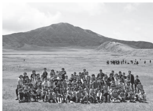
昨年の修学旅行の様子(阿蘇草千里)

普段と違う場所での活動ですので「責任と自覚を持った行動をしよう。」というめあてを持ち、班行動を中心に進めていく2泊3日です。それぞれの児童が責任を持って役割を果たし、友だちと力を合わせ、行って学んで良かった思い出に残る修学旅行になることを願っています。